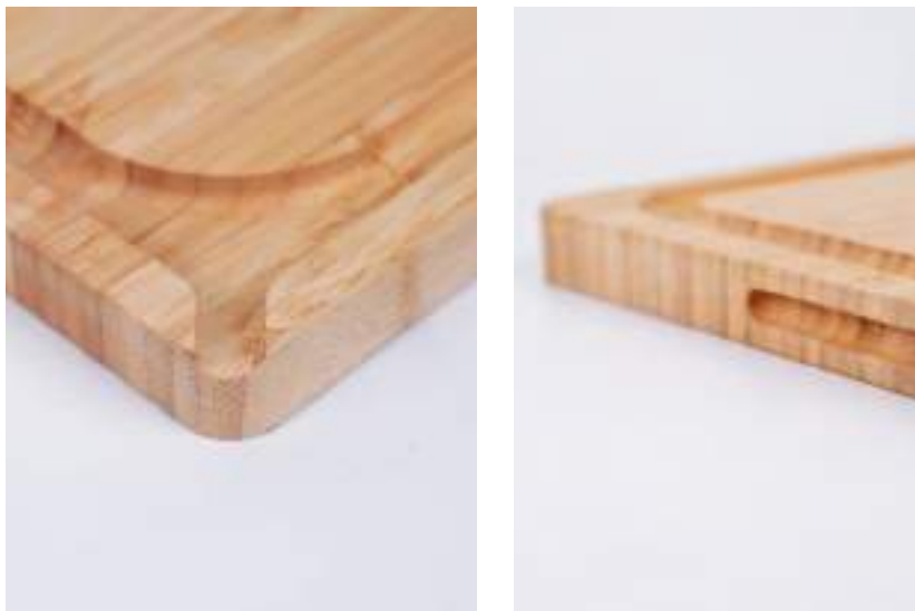
Planche à découper en bambou